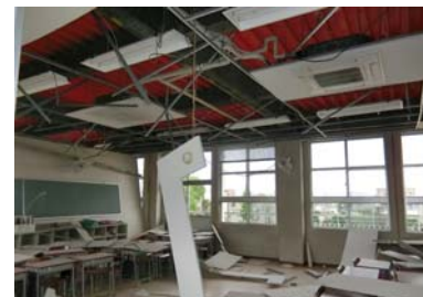
熊本大学附属小学校(教室天井崩落)