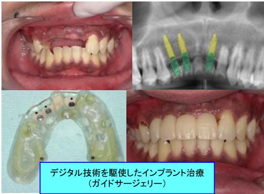
デジタル技術を駆使したインプラント治療 （ガイドサージェリー）