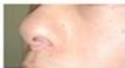
脳卒中後の後遺症として発生する構音障害

当研究室では、口腔領域における特有な機能の維持・回復を図ることを目的としてバイオエンジニアリング、口腔の軟組織や骨組織に関する生化学的研究、摂食・嚥下障害や構音障害の治療に関する研究、インプラント周囲組織についての研究、顎関節症やブラキシズムの研究、補綴治療を受けた患者のストレスの研究等その他多くの領域での研究に、教職員全員が意欲的に取り組んでいます。このような研究成果を応用し、通常の入歯からインプラト、さらには咀嚼・摂食・嚥下障害、構音障害、顎顔面補綴治療など多面的な治療に貢献すべくチャレンジしています。