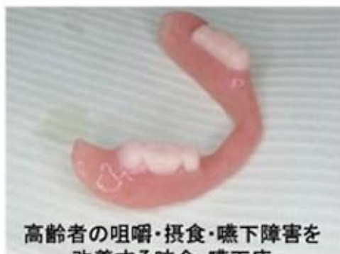
高齢者の咀嚼・摂食・嚥下障害を 改善する咬合・嚥下床