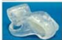
鼻咽閉鎖不全による構音障害の改善装置の開発 (Nasal Speaking Valve)