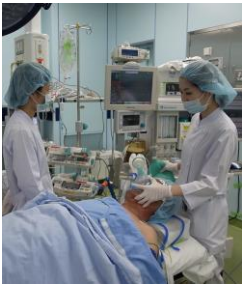
歯科麻酔科研修プログラムでの全身麻酔研修