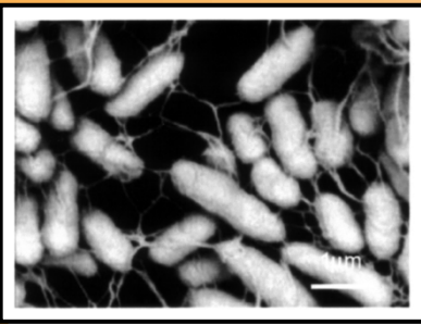
The bacterium assimilating dichloromethane (Appl Microbiol Biotechnol, 2006, 70:625-630)