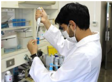
基礎研究から健康増進まで